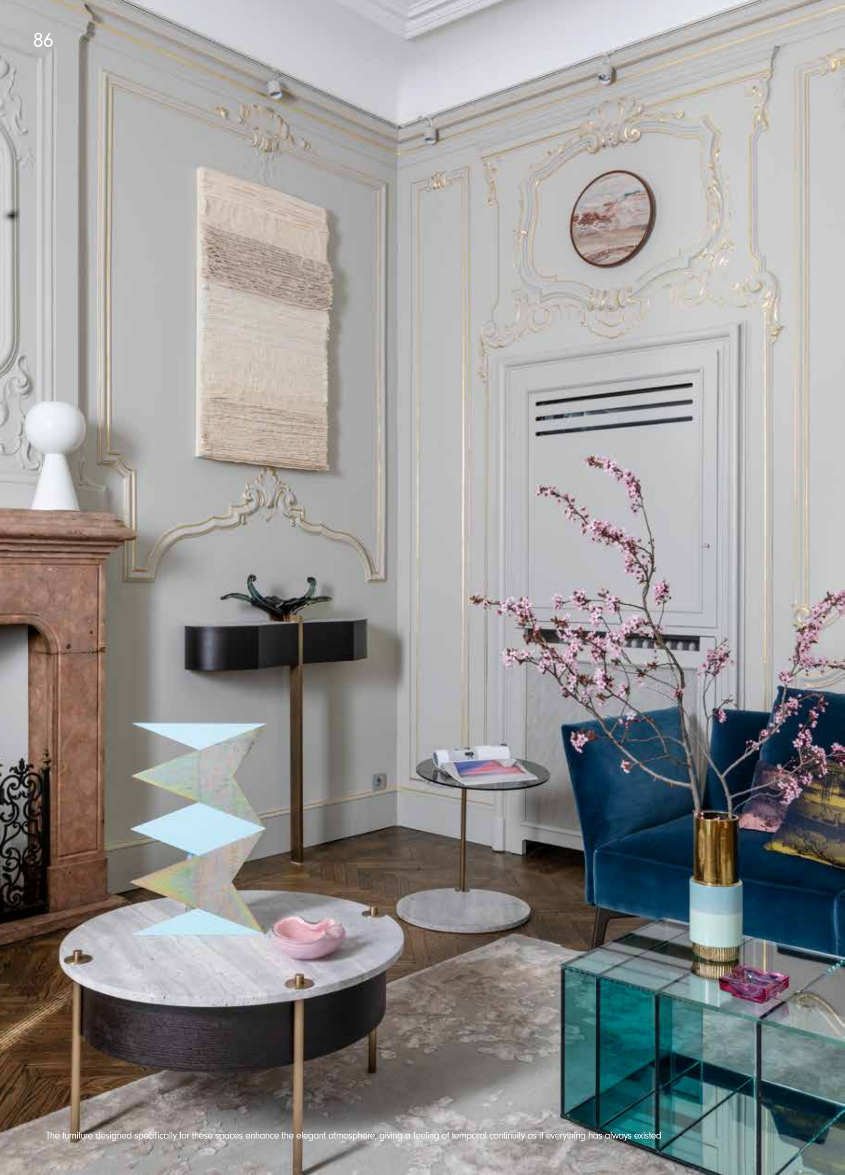
The furniture designed specifically for these spaces enhance the elegant atmosphere, giving a feeling of temporal continuity as if everything has always existed

The residence in which the architect Alessia Garibaldi decided to live, is located in a noble palace of the early twentieth century in Milan, a stone's throw from Leonardo's Last Supper in Piazza Santa Maria delle Grazie. The apartment of about 200 square meters has been divided into two separate units, respectively of 70 square meters and 130 square meters. The latter was characterized by high ceilings and simple spaces, without internal partitions, except for an important hall with antechamber, characterized by the historical pre-existence of stucco on the walls, walnut frames, two showcases passing between the two rooms and a central fireplace in red marble. The historic part has been completely restored and enhanced, the old oak parquet has been patinated with a darker color, the walls painted in light gray for the living area and a darker color "mud" in the dining room. The old plaster frames were highlighted with handmade, well-calibrated gilding. In the dining room, the ultra-slim bookcase in dark bakelite designed by the architect contains two large mirrors that trace the previous pre-existence of the two doors that connected the old apartments.