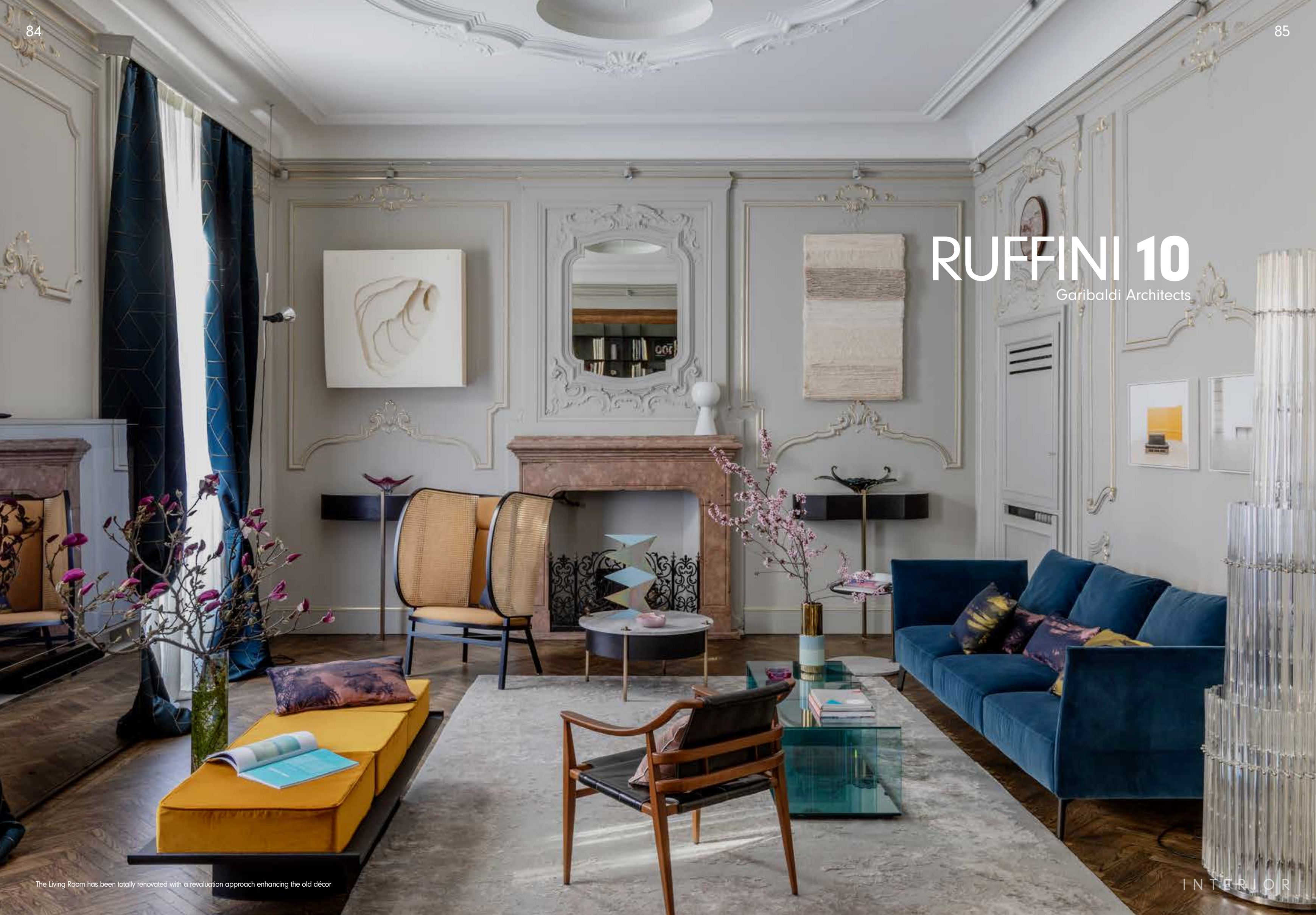
The Living Room has been totally renovated with a revaluation approach enhancing the old décor