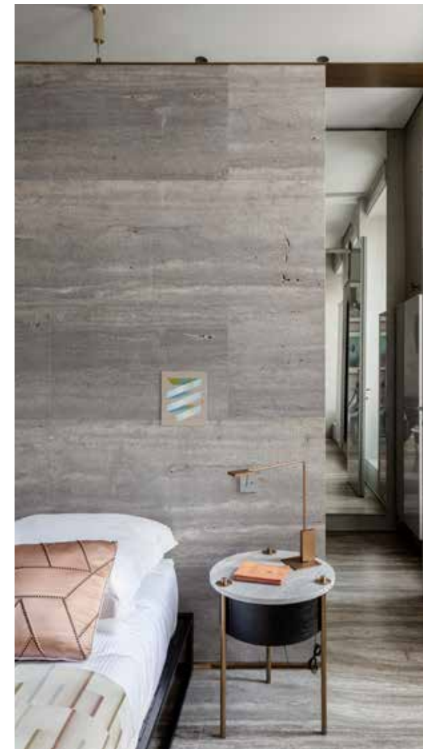
The wall made in grey Iranian travertine has been thought as real sculpture