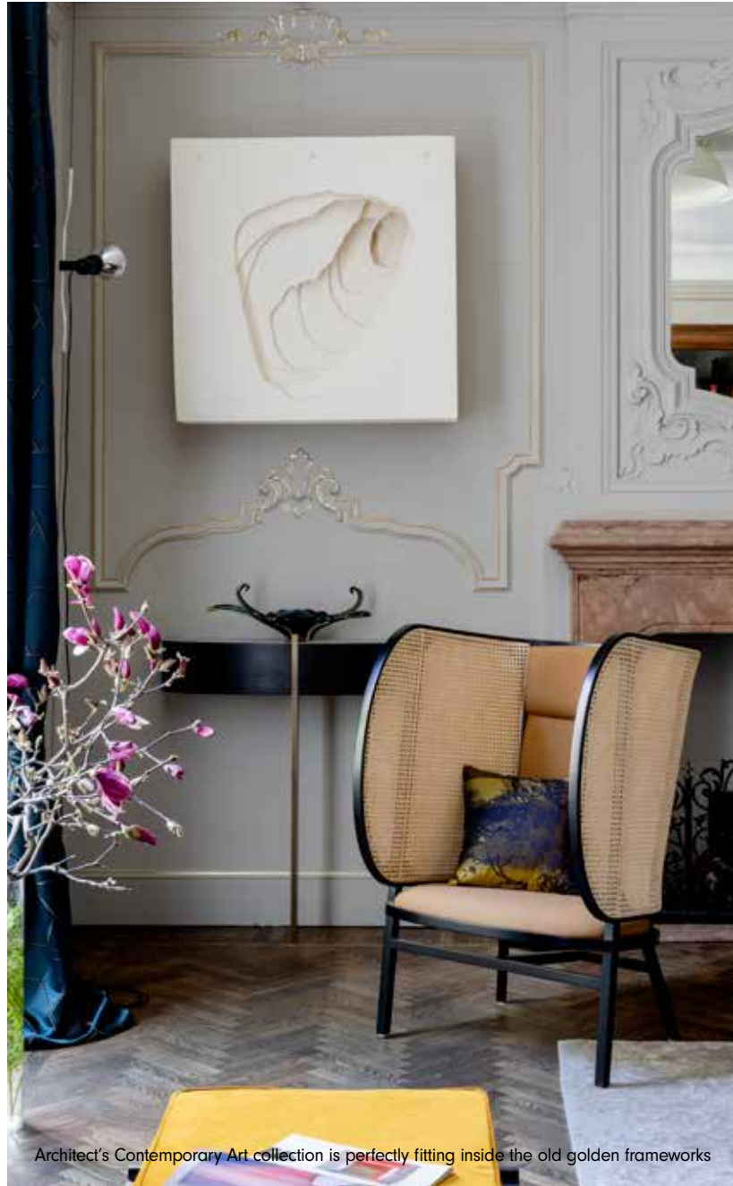
Architect's Contemporary Art collection is perfectly fitting inside the old golden frameworks