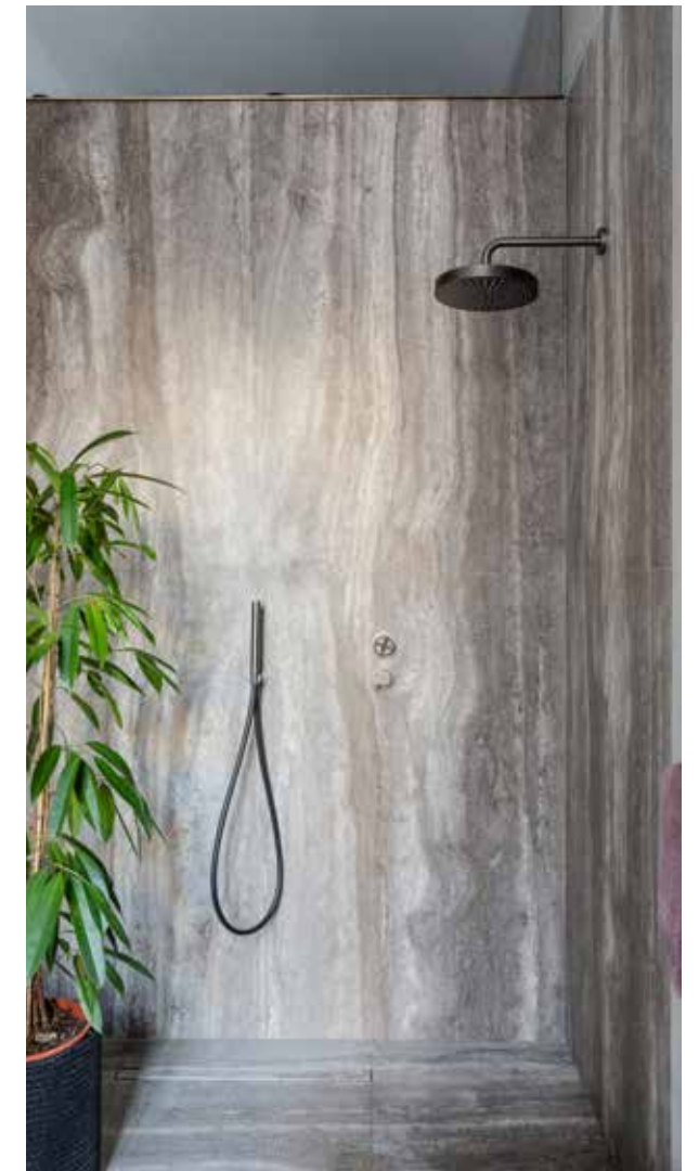
Green plants and marble are the perfect elements of well being